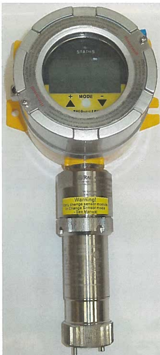
Рисунок 1 – Общий вид газоанализаторов

Общий вид газоанализаторов представлен на рисунке 1, схема пломбирования корпуса от несанкционированного доступа представлена на рисунке 2.