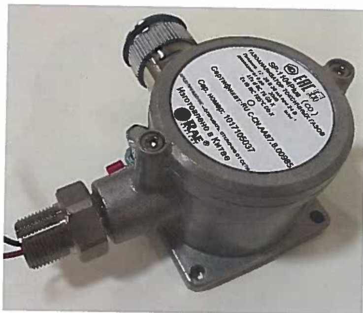
Рисунок 1 – Общий вид газоанализаторов SP-1102 (слева), SP-2102 Plus (справа)