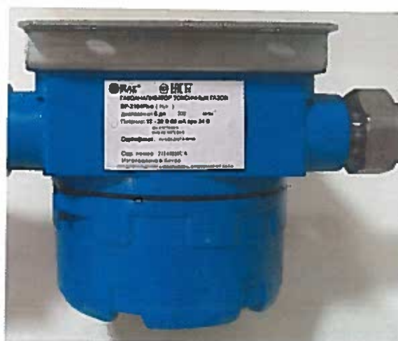
Рисунок 3 – Общий вид газоанализатора SP-2104 Plus