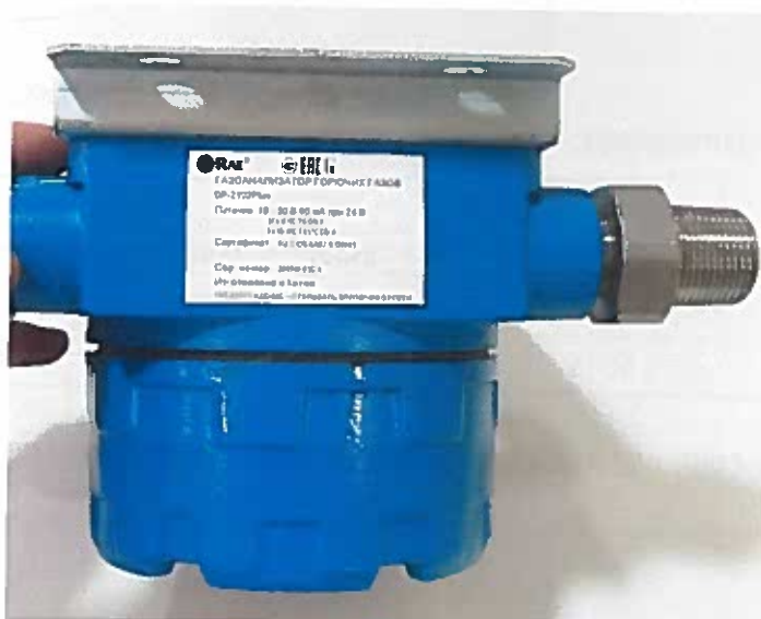
Рисунок 2 – Общий вид газоанализатора SP-2102 Plus